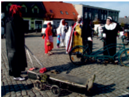
Grotteska i komizm podstawowe warunki doboru kostiumu

Gdzie szukać źródeł tradycji Cympra? Historycy widowisk wskazując początki zwyczaju karnawałowego odsyłają do greckiego patrona teatru i wina – Bachusa-Dionizosa. Wyrazistym jednak źródłem w tym przypadku są widowiska z okresu średniowiecza, które wyraźnie wpisują się w