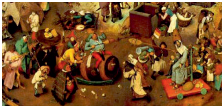
Wojna postu z karnawalem - obraz Pietera Bruegla