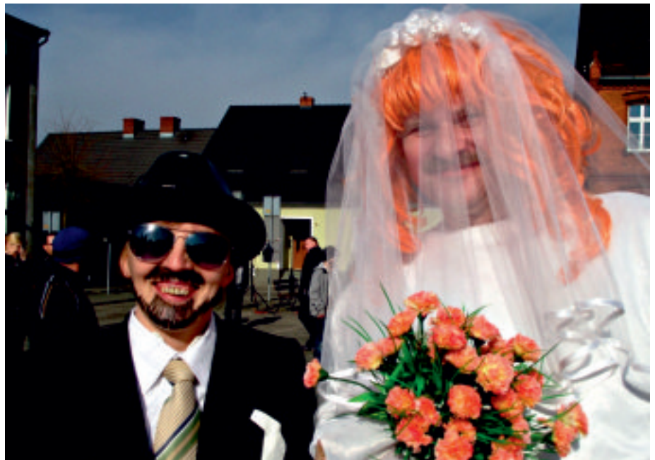
Istota karnawału - świat postawiony na głowie

kontekst tradycji chrześcijańskiej przywołując opozycję Wielkiego Postu do zapustnych hulanki i swawoli. Jak mogła wyglądać forma „cymprowania” średniowiecznego? Zapewne wiele na ten temat mówi słynny obraz niderlandzkiego malarza Pietera Bruegla Walka karnawału z postem. Bohaterzy karnawału dzielą się na tych, którzy korzystają z uciech życia i tych, którzy poszczą. Istotne jednak by w konflikcie tych dwóch obozów ostatecznie wybrzmiało porozumienie polegające na uznaniu zasad Wielkiego Postu. Wyjątkowe kostiumy to nie wszystko, w tekstach inscenizacji pojawiały się także parodie tekstów dopełniające kompozycji świata postawionego na głowie, oto jeden z przykładów: „O tłusty przenajświętszy kapłonie, pod twoją obronę