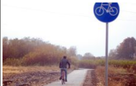
Ścieżka rowerowa znacznie skróciła przejazd rowerem do Nądni

Powstanie ścieżki rowerowej, sięgającej prawie granic gminy Zbąszyn, umożliwi bezpieczny dojazd rowerem do Swedwoodu w Chlastawie. Według zapewnień władz gminy Zbąszyn, w przyszłym roku powinien powstać dalszy odcinek ciągu rowerowego, łączącego nasze gminy.