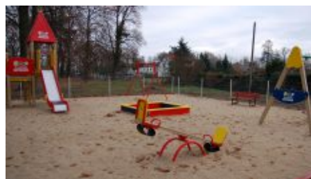
Nowy plac zabaw powstał w pobliżu kortów tenisowych przy ul. 17-go Stycznia

Zestawy zabawowe stanowiące wyposażenie placu kosztowały prawie 30 tysięcy złotych. Właścicielka supermarketu sfinansowała także montaż urządzeń na wyznaczonym i przygotowanym przez