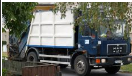
W przyszłym roku gmina wybierze odbiorcę odpadów

Ustawa o utrzymaniu porządku i czystości w gminach podpisana 15 lipca przez Prezydenta zmieni radykalnie systemy gospodarki odpadami na terenie każdej gminy. Choć część nowych przepisów zacznie obowiązywać od 1 stycznia 2012 roku ostatecznym terminem wprowadzenia wszystkich zmian w życie będzie lipiec 2013 roku.