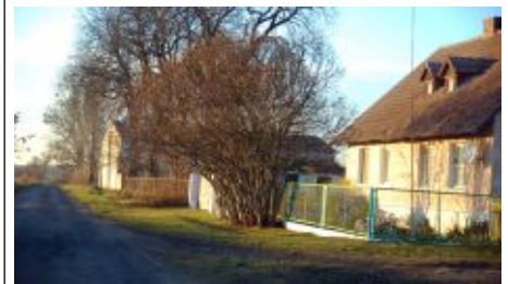
Gdzie znajduje się ten budynek?

Pytanie brzmi: Gdzie znajduje się ów obiekt, należy podać miejscowość i określić