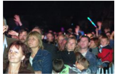
Koncert Jacka Stachurskiego przyciągnął tysiące zbąszyńców na plac przy miejskim kąpielisku