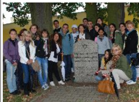
Wspólne zdjęcie w miejscu byłego cmentarza żydowskiego w Zbąszyniu

W dniach 9 do 14 października dziewięcioro uczniów ze szkoły Mekif Alef High School z Izraela odwiedziło Liceum Garczyńskiego w Zbąszyniu w ramach programu Polsko – Izraelskiej Wymiany Młodzieży. Do wizyty doszło dzięki