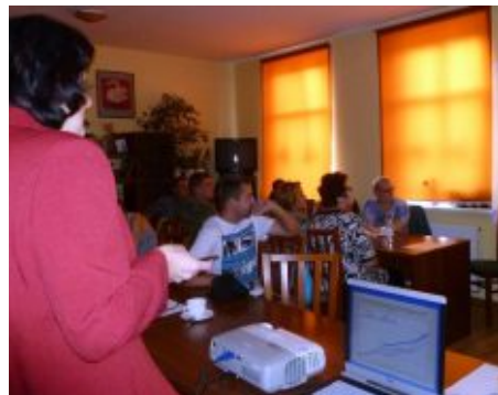
Osrodek Pomocy Społecznej w Zbąszynie organizuje wiele szkoleń podnoszących kwalifikacje

W sumie z budżetu gminy na wymienione zadania realizowane przez opiekę społeczną przeznaczona jest w 2011 roku 431 tys. zł, z kolei budżet państwa wspiera gminę w opisanym działaniu kwotą 205 tys. zł.