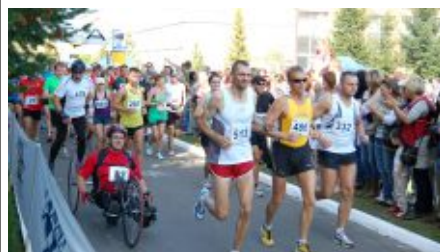
W biegu głównym uczestniczyli też niepełnosprawni

Centrum Sportu, Turystyki i Rekreacji, wprowadzili kilka zmian, aby zwiększyć komfort startu dla zawodników, m.in. biuro zawodów, szatnie i depozyt mieściły się na