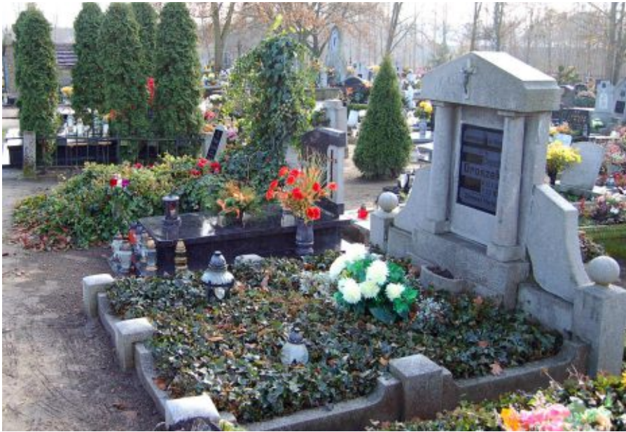
Na cmentarzu parafialnym zachowały się mogiły zasłużonych mieszkańców Zbąszynia