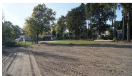
Trwa budowa nowego boiska w Łomnicy

Trwa remont kapitalny boisk piłkarskich w Nądni i Łomnicy wraz z budową infrastruktury towarzyszącej. Trawiaste nawierzchnie będą posiadały nawodnienia z własnymi ujęciami, oświetleniem i ogrodzeniem. Prace są współfinansowane przez Unię Europejską w ramach Programu Rozwoju Obszarów Wiejskich na lata 2007 – 2013. Zakończył się też remont sali wiejskiej w Nowej Wsi Zbąskiej.