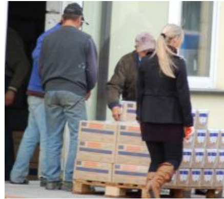
Osoby spełniające kryteria dochodowości otrzymują też żywność

staramy się jednak, w miarę możliwości, udzielać innego rodzaju pomocy. Jedną z takich form jest pomoc w postaci artykułów żywnościowych z Wielkopolskiego Banku Żywności. Także w tym przypadku na przestrzeni 2 ostatnich lat procedury udzielania pomocy uległy zaostrzeniu. Obligatoryjne kryterium dochodowe wynosi w tym przypadku 526,50 zł dla osoby w rodzinie i 715,50 zł dla osoby samotnej i może zostać przekroczone tylko