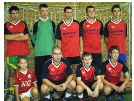
FC Beton należy do jednych z najmłodszych zespołów Kuvert Ligi

wywalczyła drużyna Promil Zakrzewo, a w III lidze Lux Torpeda.