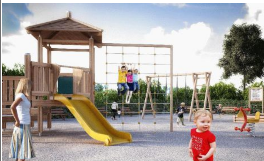
Wizualizacja placu zabaw który powstanie na Osiedlu Kawczyńskie