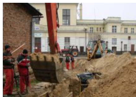
Tęgoroczna jesień sprawiła, że nawet obecnie możliwe jest prowadzenie prac budowlanych

Janka, inż. R. Pitury, Sportowej, 17 Stycznia, Dąbrowskiej, Folwarcznej, Kawczyńskiego, Kolonia, Krakowskiej, Miodowej, Orzeszkowej, Pl. Reymonta, Reja, Sienkiewicza, Żeromskiego, Prusa, Granicznej, Rejtana, Pl. Dworcowego, Kolejowej, Akacyjowej, Inż. Wigury w Zbąszyniu.