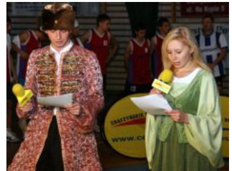
Uczniowie prowadzący dzień patrona

wszystkim, cieszymy się, że obyło się bez kontuzji. W tym turnieju wygrywają wszyscy,