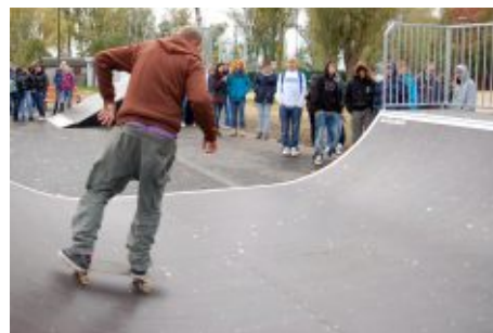
Powstanie skateparku jest odpowiedzią na wieloletnie prośby zbąszyńskiej młodzieży

Zakończono też montaż elementów skateparku w ramach projektu pn. „Rozbudowa głównych dróg rowerowych w gminie Zbąszyń oraz rozbudowa infrastruktury rekreacyjnej na plaży miejskiej w Zbąszyniu”, na który przyznano dofinansowanie w wysokości 65 % kosztów kwalifikowalnych z Wielkopolskiego Regionalnego Programu Operacyjnego na lata 2007-13. W ramach zadania zamontowane zostały następujące elementy bank ramp, quarter pipe, funbox z grindboxem, poręcz prosta, ławka i mini rampa. Całość zostanie też ogrodzona.