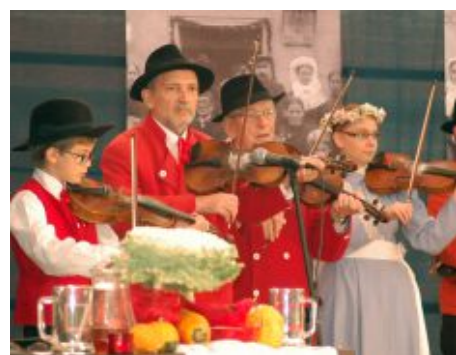
Młodzi i starsi muzycy podczas wspólnego koncertu