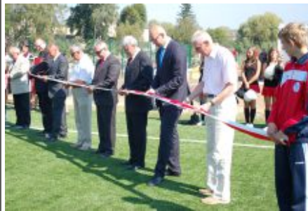
Otwarcie nowego stadionu było znaczącym wydarzeniem w historii Zbąszynia

Stadion ze sztuczną nawierzchnią, skatepark, malownicza ścieżka rowerowa i utwardzone ciągi spacerowe na plaży miejskiej „Łazienki” powstały ostatnio w Zbąszyniu. Wymienione zadania udało się zrealizować dzięki dofinansowaniu ze środków rządowych i unijnych. Nowe obiekty sportowe oraz miejsca rekreacji przyczynią się do czynnego spędzania czasu wolnego, jak również poprawią wizerunek gminy.