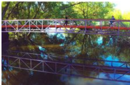
To jest wizualizacja nowej kładki

Trwają prace przygotowawcze, związane z planowaną rewitalizacją i przywróceniem dawnej świetności infrastruktury znajdującej się nad rzeką Obrą. Jako pierwszą inwestycję w latach 2012-2013 planuje się zrealizować prace związane z