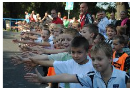
Najmłodszy biegacze dopingowali uczestników półmaratonu

Nad sprawną organizacją biegów dziecięcych, młodzieżowych i biegu głównego czuwały rzesze przeszkolonych wolontariuszy (m.in. nauczycieli i uczniów szkoły podstawowej, gimnazjum, a także miejscowego liceum), bez których pomocy i zaangażowania impreza nie mogłaby się odbyć w tym wymiarze. Na trasie otuchy dodawali zawodnikom okoliczni mieszkańcy, pięknie dopingując biegowe starania,