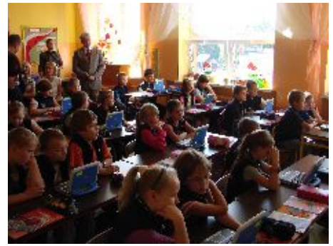
Nowoczesny sprzęt pomoże w nauce