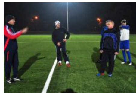
Piłkarze już trenują na nowym stadionie

Po wielu latach oczekiwań udało się dokończyć budowę nowego stadionu piłkarskiego w Zbąszyniu. Jest to pierwsza pełnowymiarowa płyta ze sztuczną nawierzchnią w Wielkopolsce, zrealizowana w ramach pilotażowego programu rządowego „Orzeł”. Zadanie otrzymało milionowe wsparcie z Ministerstwa Sportu, dzięki osobistemu zaangażowaniu posła na Sejm RP Jakuba Rutnickiego.